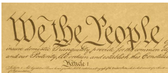
Incipit della Costituzione degli Stati Uniti d'America

In un momento così complesso anche per la nostra democrazia che cosa possiamo fare noi credenti e semplici cittadini? Proviamo a ripartire da Montesquieu per capire il nocciolo della sfida. Ne "Lo spirito delle leggi" (1748) osservava che "in uno stato democratico ci vuole una molla in più che è la virtù "... una preferenza continua verso l'interesse pubblico in confronto al proprio". E soggiungeva: "E' nel governo repubblicano che si ha bisogno di tutta la potenza dell'educazione..."